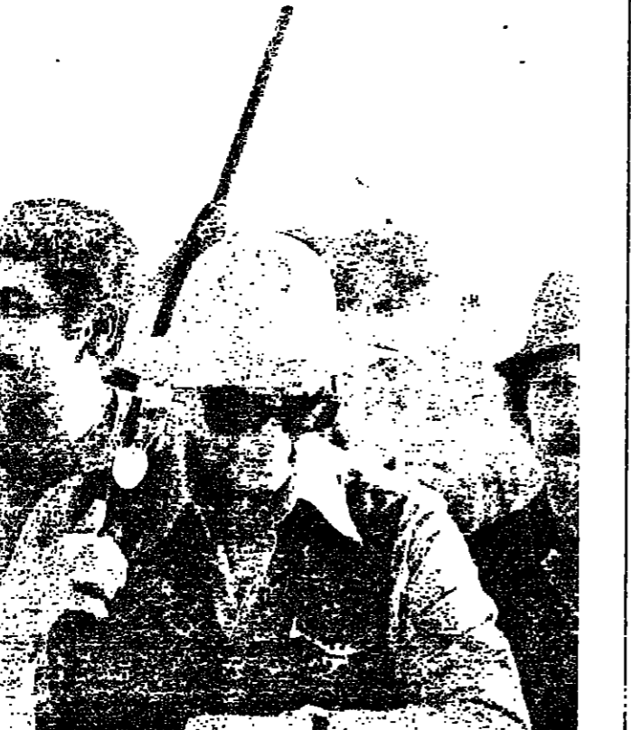
شمعون ينظر الى ساعة